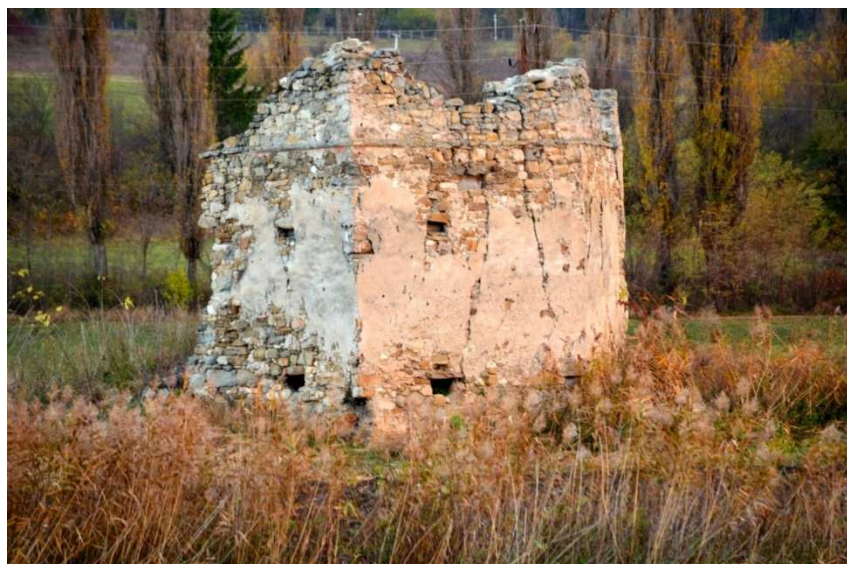
Apáca várának maradványai